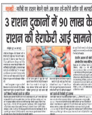
3 राशन दुकानों में 90 लाख के राशन की हेराफेरी आई सामने

उनका इस मामले से कोई लेना-देना नहीं है। न तो राशन दुकान उनके नाम पर है और जो राशन दुकान उनके रिश्तेदार चला रहे हैं वे कड़े इन दुकानों में नहीं बैठते। लेकिन, उन्होंने हर माह राशन दुकानों में भेजे जाने वाले चावल के बोरो में हेराफेरी होती है और इस शॉर्टेज की जानकारी मिलेगी, जिसके लिए मुझे भिड़ना पड़ेगा।