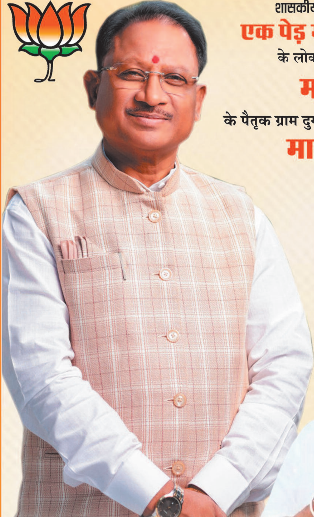
मान. विष्णुदेव साय जी मुख्यमंत्री, छत्तीसगढ़ शासन

शासकीय उच्चतर माध्यमिक विद्यालय दुर्गापाली विखं बसना में एक पेड़ माँ के नाम कार्यक्रम एवं सिंदूर पार्क